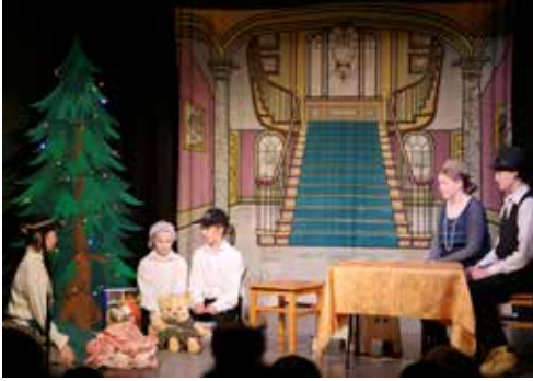
Teddy's Story: Begeisterung auf allen Seiten

Das Wandsbeker Kindermusiktheater St. Stephan gab wieder eine Uraufführung: Teddy's Story. Da musste ich hin. Dass und wie hier Kinder und Jugendliche für Jung und ebenso interessant für älteres Publikum singen und spielen, hatte mich schon wiederholt restlos begeistert, genau wie diesmal!