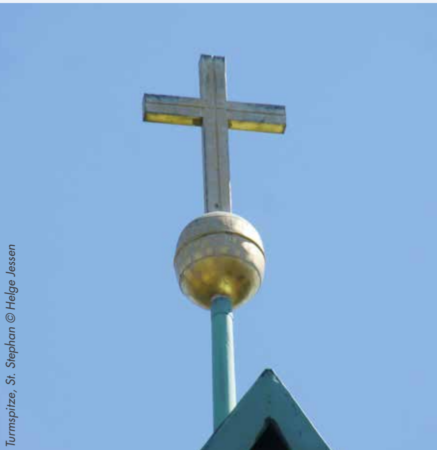
Turmspitze, St. Stephan © Helge Jessen