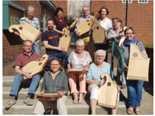
Harfen unter dem Glockenturm von St. Stephan

Bereits im Juni sollen dann drei kleine Harfenspiel-Gruppen beginnen, eine davon auch in Tonndorf. Interessierte melden sich bitte bei Pastor Jan Simonsen. Wir danken der Bezirksversammlung Wandsbek für die Zuschussung der Harfen.