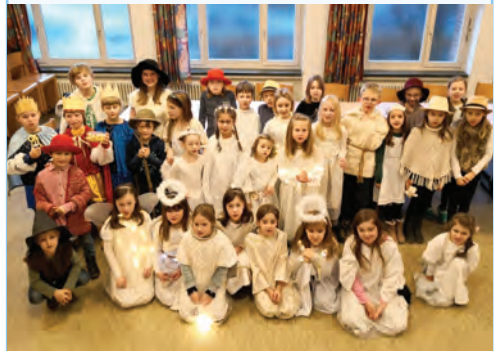
Kindersingschule beim Krippenspiel 2019

Wandsbeker Kindersingschule zu Gast beim Kinderchorfestival „Do-Re-Mi“ im Musikpavillon „Planten und Blomen“