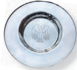
Unsere Taufschale mit eingravierter Taube

Diesmal wollen wir auch eine Taufe feiern – und freuen uns dabei auch auf die musikalische Beteiligung der „Wandsbeker Kindersingschule“.