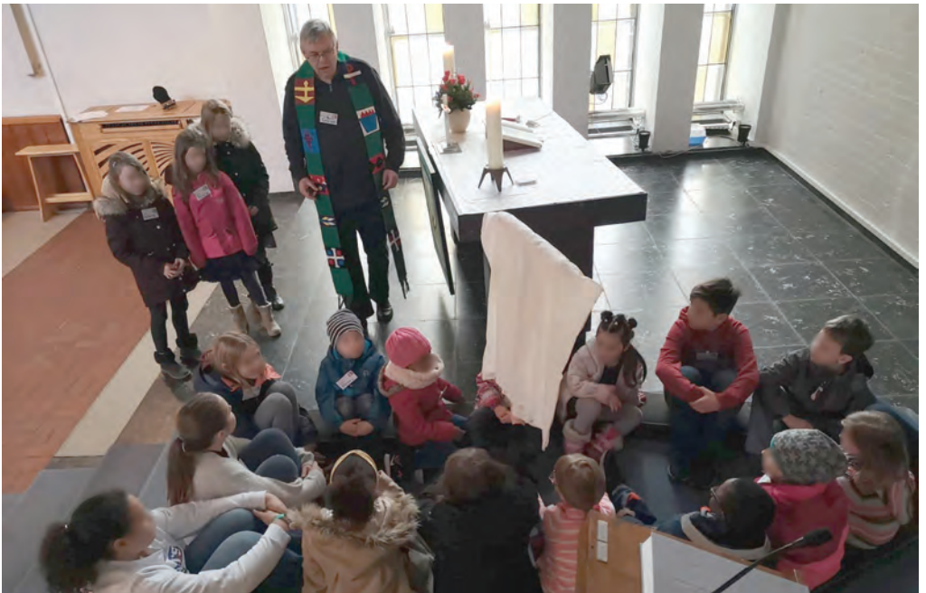
„Mit Jesus in einem Boot“ – mit Spaß und wehendem Segel spielen die „KiKi- Kinder“ die biblische Geschichte nach...

Die nächsten Termine finden Sie immer auf unserer Schlusseite 28 (unten).