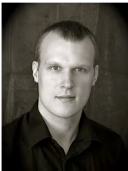
Pianist Gunnar Haase

Eintritt 8.-, erm. 6.- Euro / Abendkasse, bis 17 Jahre freier Eintritt