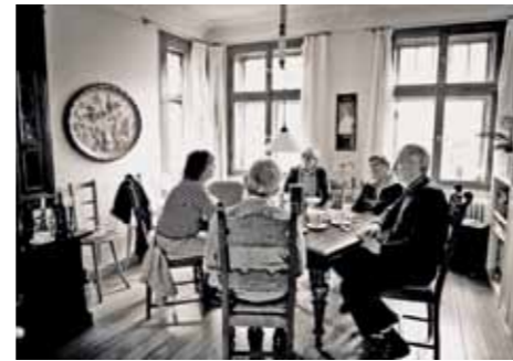
(oben) Engagiert und verschworen: Treffen der Gästewohnungsbetreuer