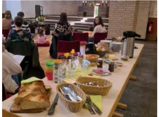
↑ ... mit Osterfrühstück.