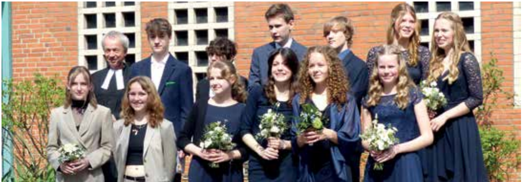
↑ Die Konfirmand:innen des Jahres 2023