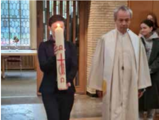
↑ Oster-Gottesdienst ...