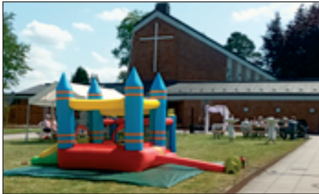
Die Hüpfburg für Kinder war sehr beliebt. Vielen Dank an die Jugendgruppe für die Betreuung!