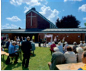
Grüßworte und Sekt mit Blick auf das neu eingeweihte Kreuz nach dem Festgottesdienst mit ca. 150 Gästen