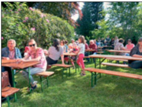
Ca. 120 Leute sind zum Brahmsee-Treffen gekommen, einige sind dafür hunderte Kilometer aus anderen Städten angereist. Das war ein „hallo“!