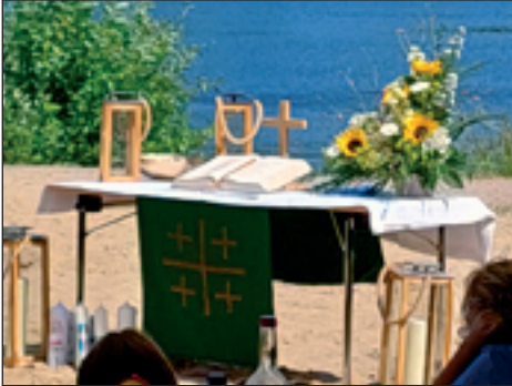
Der Altar beim Tauffest der Region am 24.6.