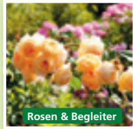
Rosen & Begleiter