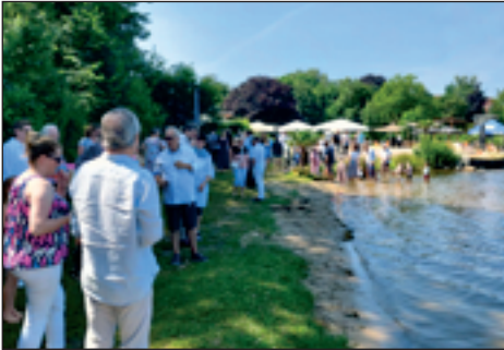
Getauft wurde im See der Cablesport-Arena.