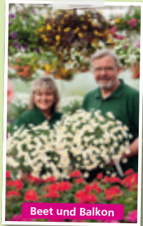
Beet und Balkon

Wir kultivieren viele unserer Pflanzen noch selber!