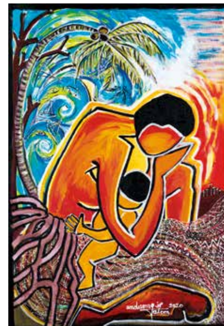
„Cyclon PAM II. 13th of March 2015“ von Juliette Pita. Das Gemälde zeigt die Situation auf Vanuatu, als der Zyklon Pam 2015 über die Inseln zog.