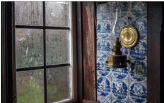
Abb.: Bibelfliese im Rieck Haus „Die Kundschafter Josua und Kaleb mit der Riesentraube“

Abb.: „De blauwe Stuuw“ – Lütt Döns im Rieck Haus mit Bibelfliesenwand