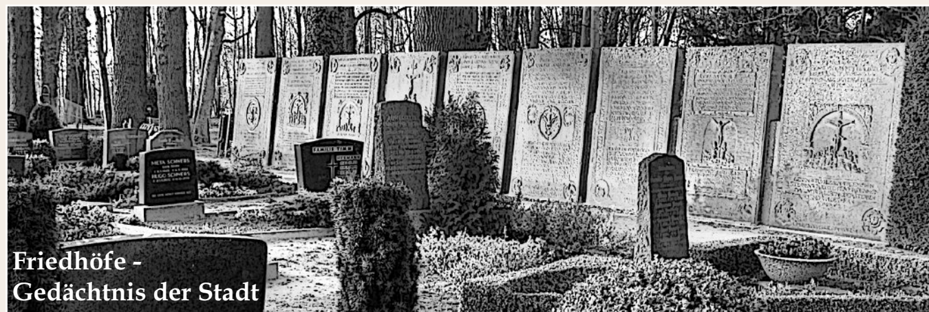
Friedhöfe - Gedächtnis der Stadt

Sandsteinplatten in die Hamburger Denkmalliste aufgenommen. 1950 nimmt dann Pastor Otto H. E. Grau (hier 1945-1976) die alten Pläne seines Vaters auf und stellt 1952 mit örtlichen Betrieben 9 der großen Grabplatten „als Mauer“ an der Nordseite des Friedhofs sowie 7 an der Ostseite auf; damit ist ein erster Teil der alten Grababdeckungen gesichert. 1972 folgten die restlichen 35 Platten an der Ostseite des Friedhofs; parallel zum Kirchenheerweg. In 2000 fand eine gutachterliche Bestandsaufnahme der Grabplatten-Qualität durch das Zentrum für Materialkunde / Hannover statt. Aber erst 2016 konnte man die erste alte Grabplatte durch eine Restauratorin konservieren lassen; weitere sollen folgen.