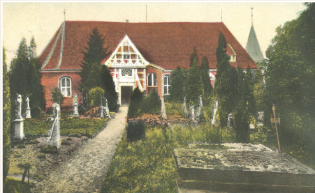
Die Postkarte von 1905 zeigt die liegenden Grabplatten