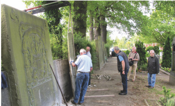
Mitglieder des Fördervereins bei der Abnahme am 1.6.2016

Der „Förderverein St. Severini zu Kirchwerder“ hat sich zum Ziel gesetzt, die auf dem Friedhof stehenden historischen Grabplatten der Öffentlichkeit nahe zu bringen und den Bestand für die nächsten Generationen zu sichern. So gründete sich 2015 eine Projektgruppe zur Betreuung der Sanierung. Das Denkmalschutzamt Hamburg fördert das Projekt. Als erste der Projekt-Reihe wurde am 1.6.2016 die auf der Ostseite des Friedhofs stehende und hier am südlichen Ende befindende Grabplatte aus Elbsandstein, mit dem Relief „Sündenfall - Adam und Eva mit dem Baum der Erkenntnis“ und der Umschrift: „HEIN ALBERS (...) ANNO 1610 ADI 20 JULI STARFF WOBKE ALBERS SEHLICH IN GOT DE GOT GNE-DIG SI“, abgenommen, restauriert und danach neu aufgestellt. - Für Besucher wurde am nördl. Friedhofs-Eingang eine Informationstafel errichtet.