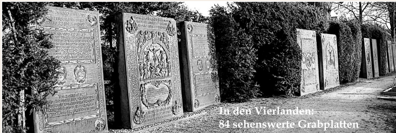
In den Vierlanden: 84 sehenswerte Grabplatten

Auf diesem kirchlichen Friedhof der St. Severini-Kirche zu Kirchwerder (in den Vierlanden bei Hamburg) stehen 84 überwiegend großformatige Grabplatten aus der Zeit von 1586 bis 1753 . Es ist Norddeutschlands größte zusammenhängende Ansammlung historischer Grabplatten.