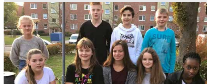
Unsere Konfirmand*innen zum Beginn der Konfizeit 2018

Wir wünschen den Konfirmandinnen und Konfirmanden Gottes Segen und stets einen begleitenden Engel zur Seite!