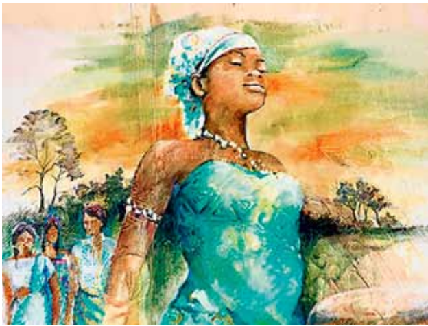
„Gran tangi gi Mama Aisa (In gratitude to mother Earth)“, Sri Irodikromo

Am 2. März 2018 feiern wir den Weltgebetstag der Frauen aus dem südamerikanischen Surinam! Unter dem Motto: „Gottes Schöpfung ist sehr gut!“ (Gen1, 31) sind wir eingeladen uns der Vielfalt ihres Landes zu öffnen und sie miteinander zu feiern, denn als kleinstes Land Südamerikas ist es gleichzeitig auch eines der buntesten.