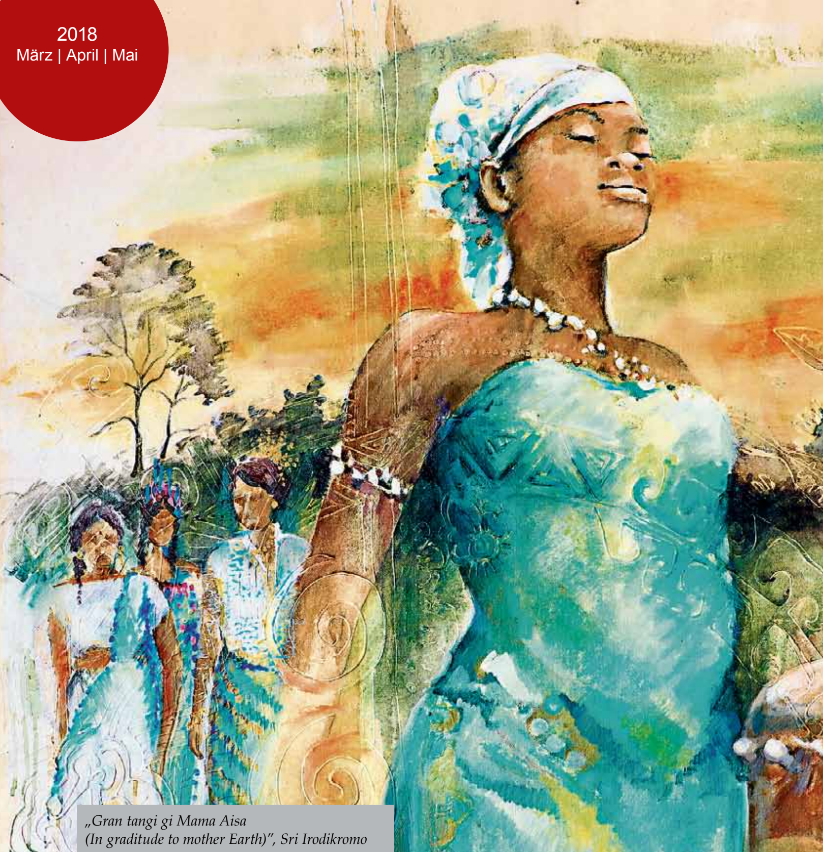
„Gran tangi gi Mama Aisa (In gratitude to mother Earth)“, Sri Irodikromo