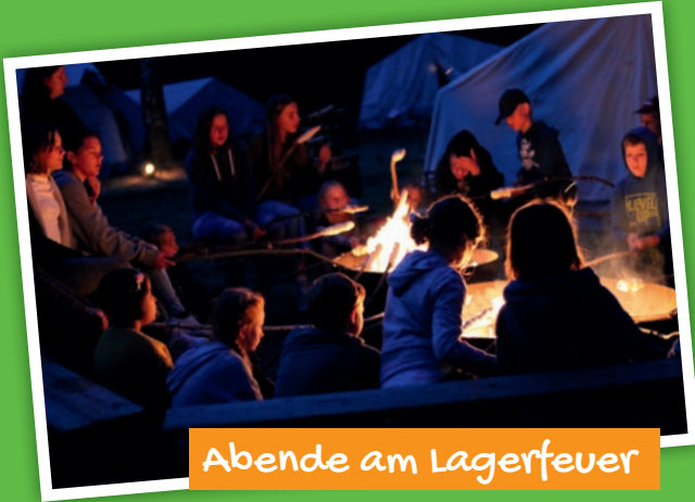
Abende am Lagerfeuer