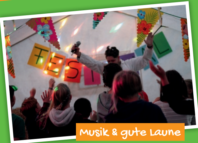
Musik & gute Laune