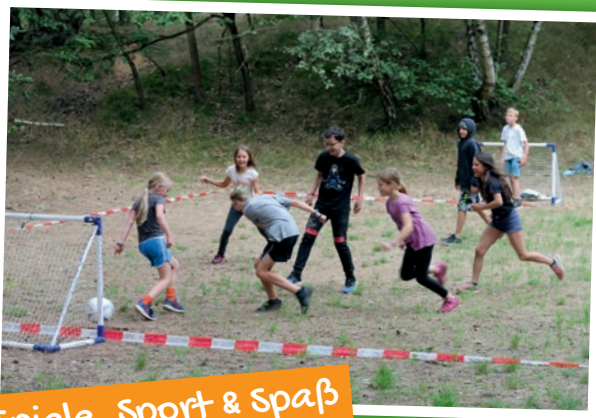
Spiele, Sport & Spaß