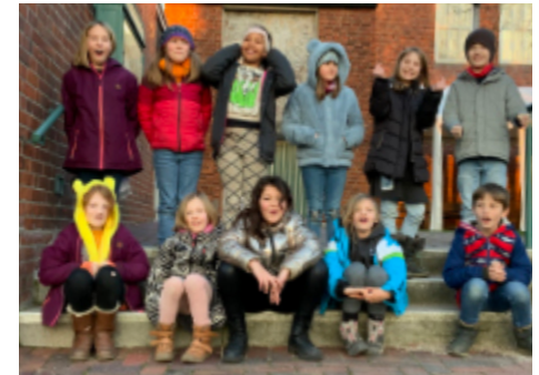
Lerchen-Gruppe (3. - 5. Klasse)

Unsere Probenzeiten findet ihr auf Seite 26.