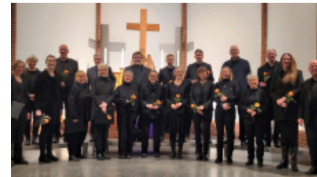
Wandsbeker Kammerchor, 4. Advent 2022

Der Kammerchor feiert sein einjähriges Bestehen. Wir blicken stolz zurück auf drei gelungene Projekte (Karfreitag 2022 – Sommer 2022 – Advent 2022) und freuen uns auf das vierte am 7.4. um 15 Uhr in der St. Stephan Kirche (siehe Ankündigungen auf den folgenden Seiten).