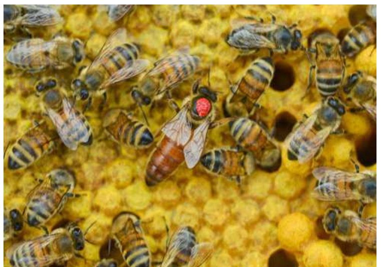
Markierte Königin mit Arbeiterinnen auf verdeckelten Brutzellen. Unten rechts im Bild die großen Huppel sind verdeckelte Drohnenbrut