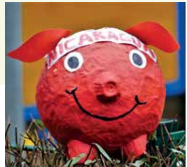
Dieses Sparschwein hat schon viele Nicaragua-Euros gesehen

Mit diesen Eindrücken und noch einmal einem herzlichen Dankeschön für die großartige Unterstützung für dieses Projekt grüßt Ihr Nica-Förderkreis!