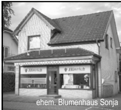
ehem. Blumenhaus Sonja