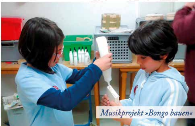
Musikprojekt »Bongo bauen«