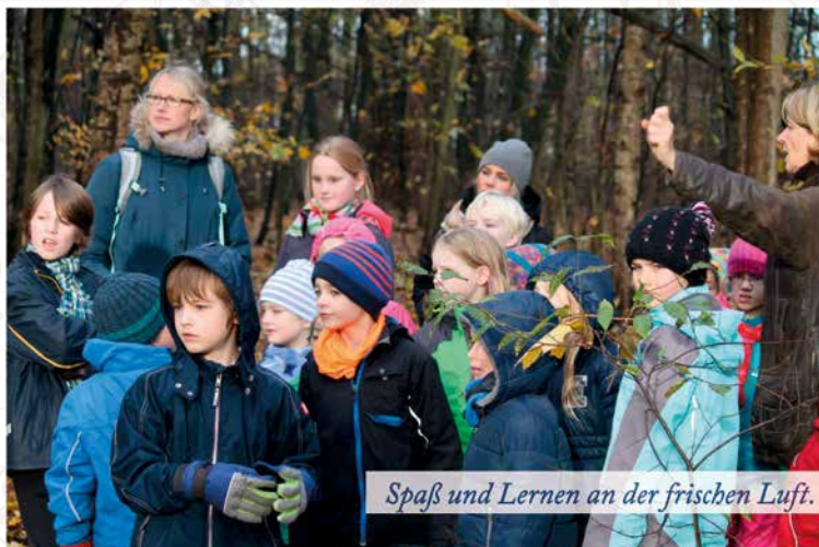
Spaß und Lernen an der frischen Luft.