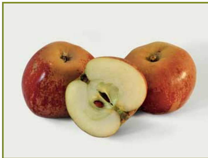
Rotfranch Apfel des Jahres 2012